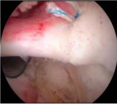
関節鏡像：鏡視下上方肩関節唇修復術

投球障害肩、すなわち上方関節唇（SLAP 病変）や中関節上腕靭帯（MGHL）損傷に対して行われる手術です。これらには、いわゆる Minor Instability（微小な不安定症）と呼ばれる病態が含まれます。3-4ヶ所のポータルを作成し、鏡視下に剥離した上方関節唇や緩んだ靭帯を、先ほど記述した特殊なソフトアンカーを用いて修復します。入院期間はおよそ5-6日です。