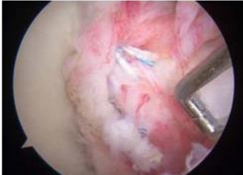
関節鏡像：鏡視下バンカート修復術

肩関節脱臼・亜脱臼で生じた靭帯の機能不全に対して、緩んだ靭帯を鏡視下に修復(再建)する手術です。糸だけでできた非常に小さなソフトアンカーを用いて、緩んだ靭帯を適度な緊張がかかるように修復します。ポータルは3ヶ所ほど作成します。入院期間はおよそ5-6日です。