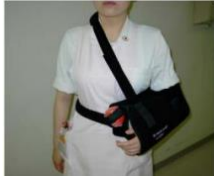
術後の肩外転装具固定