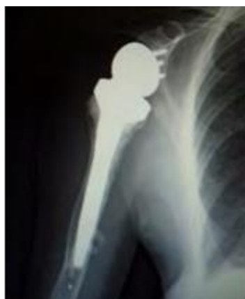
術後レントゲン（リバースショルダー）

進行した変形性肩関節症・腱板断裂性肩関節症、あるいは上腕骨頭壊死（骨組織が血流不全になること）などに対して行われる手術です。この手術は、関節鏡視下手術ではありません。平成 26 年春より、日本でも人工肩関節置換術の特殊型であるリバースショルダーを行うことができるようになり、当院でも現在までに 2 例のリバースショルダー手術を施行し、経過は良好です。肩が自力で挙上できなくなった進行した肩の変性疾患症例でも、リバースショルダー手術を行うことで自動挙上が可能になる場合があります。今後もそのような病態の患者さんに対しては、手術の適応をしっかりと判断して、必要であればリバースショルダー手術を行っていきます。入院期間は、2-3 週間です。