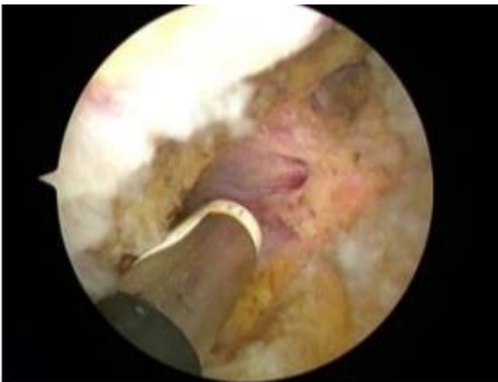
関節鏡像 鏡視下肩関節授動術（関節包切離術）

難治性の肩関節拘縮に対して行われる、「肩がよく動くようにする手術」です。拘縮の原因である硬くて分厚くなった関節包を、鏡視下に切離して関節包を拡大します。この手術を行うことで、可動域制限を改善するとともに、強い痛みを劇的に軽減する効果もあります。手術直後から、肩の夜間痛が消失し、楽に睡眠がとれるようになる場合も多くあります。肩関節拘縮に対しては、保存治療が第一選択肢ですが、長く続く痛みや挙上障害に対しては、この手術も状況に応じて選択肢となります。入院期間は、およそ1週間です。