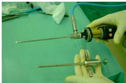
関節鏡 上：径 4 mm・30 度鏡（カメラ） 下：外筒管

関節鏡視下手術とは、各関節の周囲にわずか 6~7mm の皮膚切開を数個作り、この小さな出入口（ポータル）から細いカメラや手術器具を関節内に入れて行う手術のことです。関節鏡視下手術では、皮膚を切る大きさが劇的に小さいばかりでなく、関節周囲の健全な筋肉なども傷つけることなく手術が行えるため、術後の痛みが少なく、機能の回復が早いことが分かっています。当然、術後の傷も目立ちません。