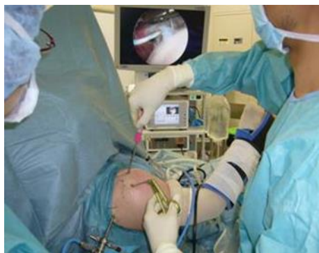
肩関節鏡視下手術（手術室）

2022 年の 1 年間で行った関節鏡視下手術は、肩関節鏡視下手術が 145 件、人工肩関節置換術 20 件、膝関節鏡視下手術が 131 件、合計 296 件でした。