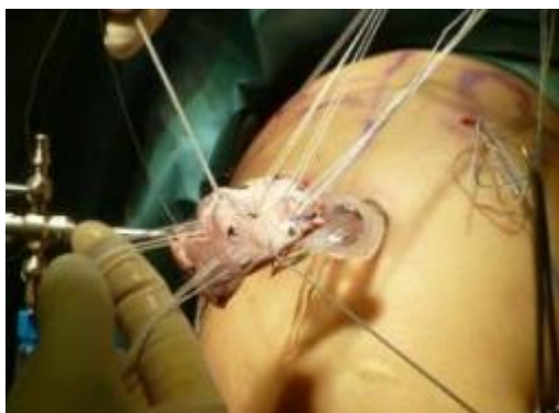
鏡視下上方関節包再建術大腿筋膜の関節内への挿入時

の手術を行うことで、バイオメカニクスの的に肩関節機能が向上することが、肩関節のモデルを使った研究で明らかになっています。入院期間は、およそ 4 週間です。