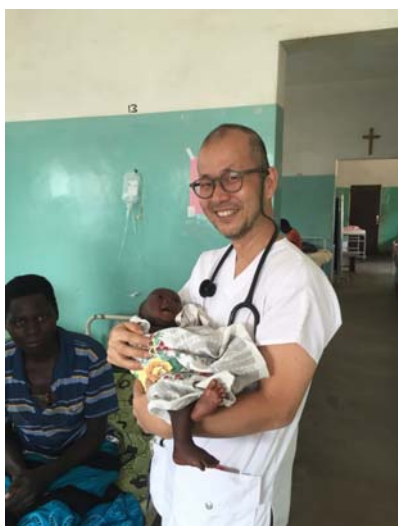
カロongo病院で 患者の赤ちゃんを

引き続き、日赤社員一同で世界各地の医療の質を向上させ、日本の赤十字の存在感をしっかりとアピールできるよう努めてまいりたいと思います。どうぞ温かいご寄付を賜りますよう、心よりお願い申し上げます。